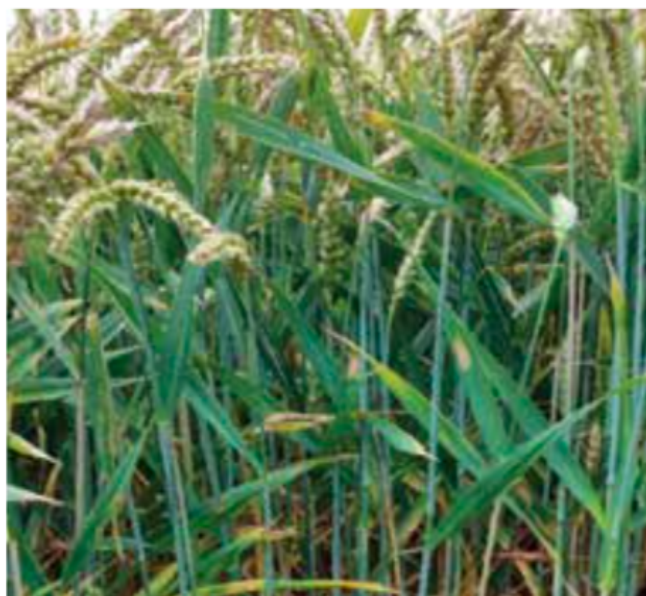
ELATUS™ Era 1 l/ha