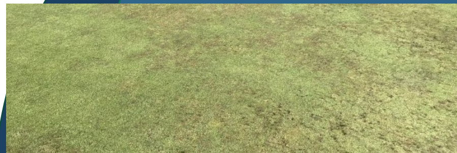
Pred aplikáciou AquaCept

Baktérie obsiahnuté v AQUACEPT sú špecifické tým, že dokážu tráviť tieto hydrofóbne častice a konkurovať efektívne s týmito hubami o živiny. Baktérie v AQUACEPT produkujú proteázové enzýmy ktoré degradujú biele hydrofóbne proteíny vylučované hubami basidiomycetes bežne vyskytujúcimi sa v Fairy Rings a ktoré spôsobujú hydrofóbnosť pôdy. Ideálne aplikovať po aplikácii penetračného zmáčadla.